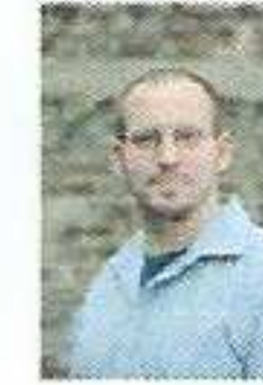
Sebastian Ritscher Redaktion Bochum